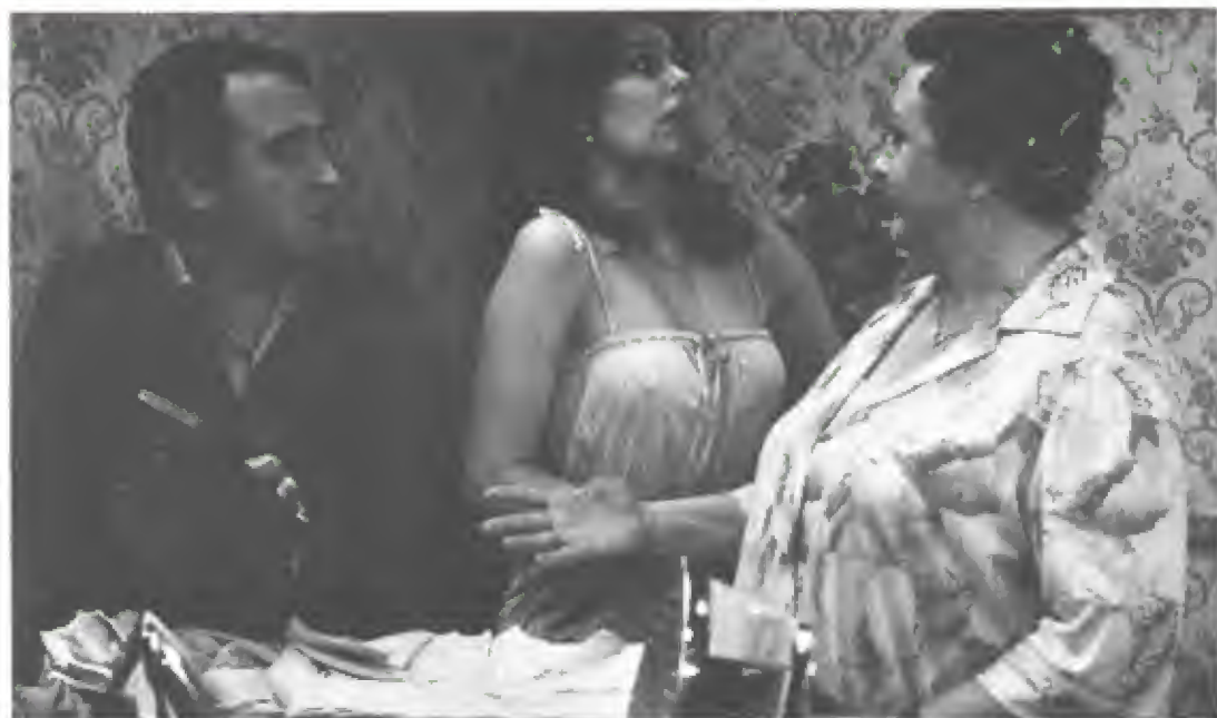
Fernando Esteso - Violeta Cela - Florinda Chico